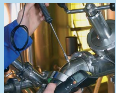
Connessione per sonde di temperatura esterne (testo 830-T2)