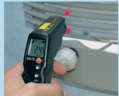
Misure affidabili grazie al puntatore laser