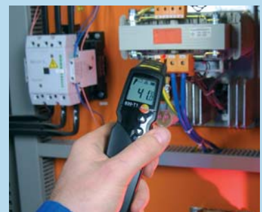
Misure su componenti in tensione o in movimento