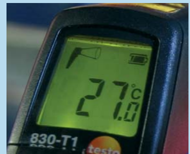
Ampio display retroilluminato